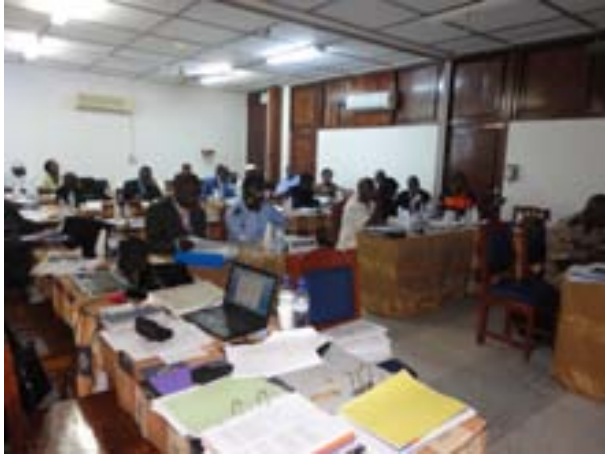
Workshop Venue "Infosec"