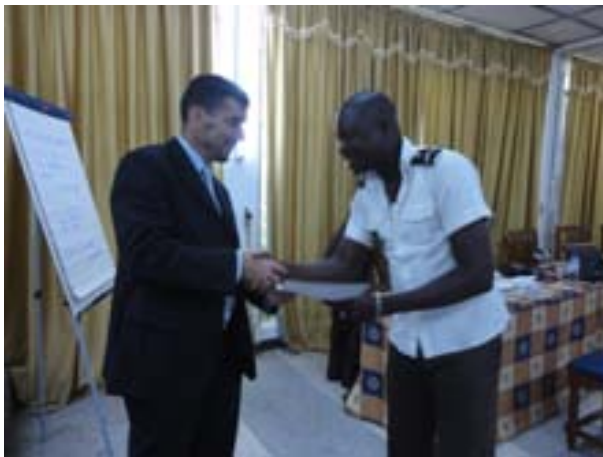
Hand out of certificates