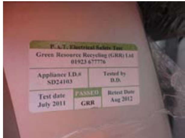
Sticker of electrical safety test "passed"