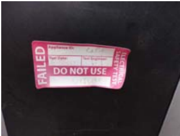
Sticker of electrical safety test "failed"