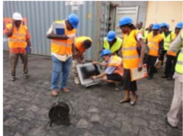
Testing of (W)EEE